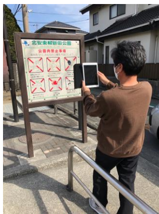
スタッフによる現地確認の様子