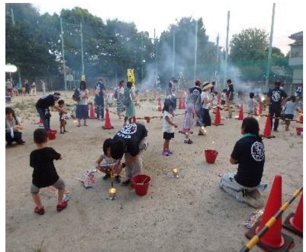
* 過去開催の花火教室